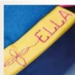
3 Nähschriften zum Personalisieren Ihrer Projekte.